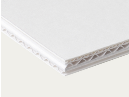
EBB 8.0 mm